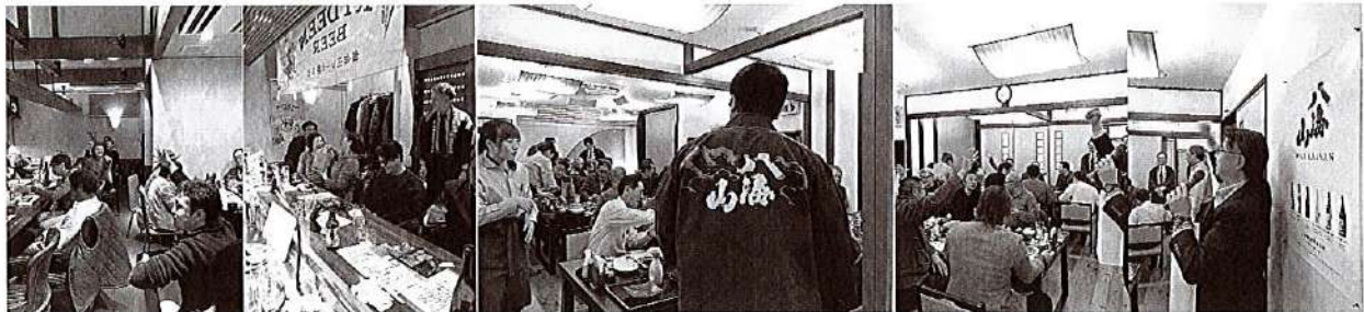
社長恒例のじゃんけん大会

今年に入り、コロナショックで騒がれる前までは、日本酒の会を数回行い、この春～夏にかけても企画中だったというのに…… 全て中止。残念です、仕方ない。